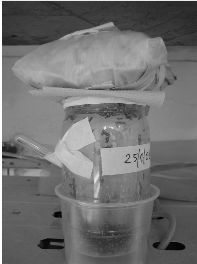
תמונה 1. צנצנת הטלה לבוגרי הלקטית ורודה