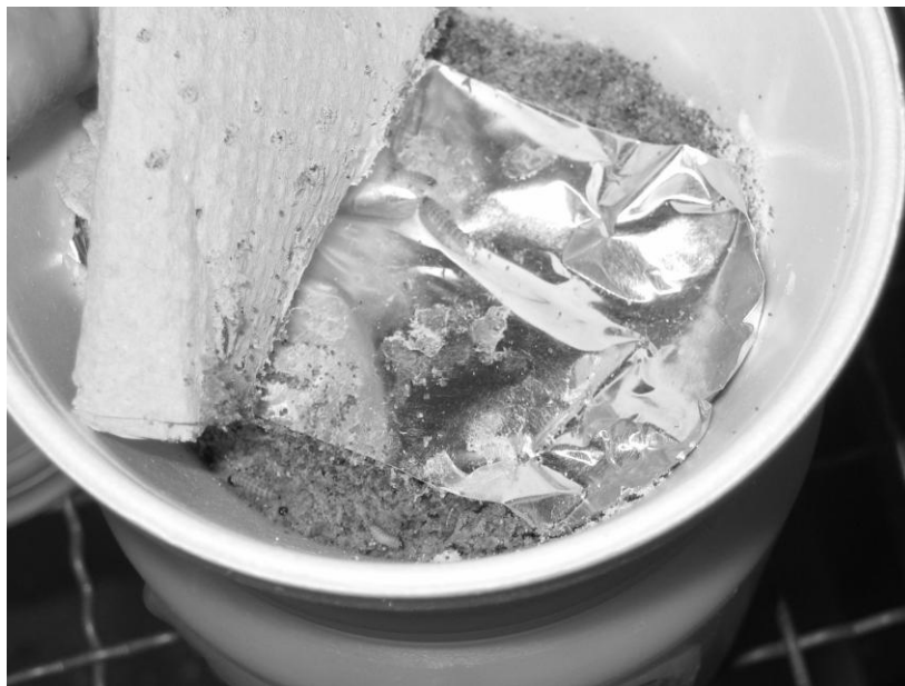
תמונה 4. הזחלים לפני התגלמות במכל הקלקר.

כדי להימנע מלחות עודפת לביצים, מוצמד נייר ההטלה לדופן המכל. הזחלים הראשונים (נאונטים) צונחים למצע המזון ומתפתחים במשך זמן של כ- 10-14 יום לדרגת טרום גולם (חמישית). בדרגה זו הם מחפשים מצע יבש יותר להתגלמות ורובם מחררים את תחתית כלי הקלקר (תמונה 5) וצונחים לתוך מכל נוסף עם פתחי אוורור שמוצמד