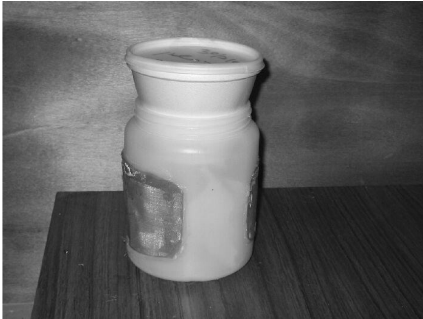
תמונה 3. מכל הקלקר עם הזחלים הצעירים "מולבש" לתוך צנצנת ההתגלמות.