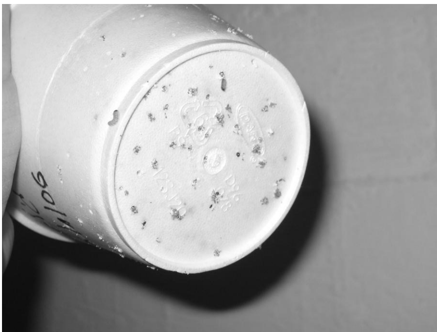
תמונה 5. הגלמים הגדולים מחוררים את קרקעית הכוס בדרכם לצנצנת ההתגלמות

לתחתית הקלקר, שם מונחים ניירות מקופלים. לאחר כ-7 ימים נשלם תהליך ההתגלמות והגלמים המוכנים מועברים לצנצנות הטלה כנ"ל.