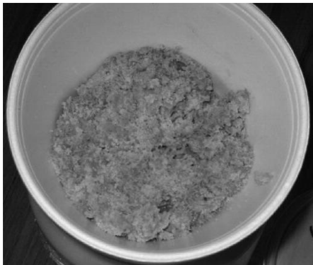
תמונה 2. מצע המזון בתוך מכל הקלקר שבתוכו מתפתחים הזחלים