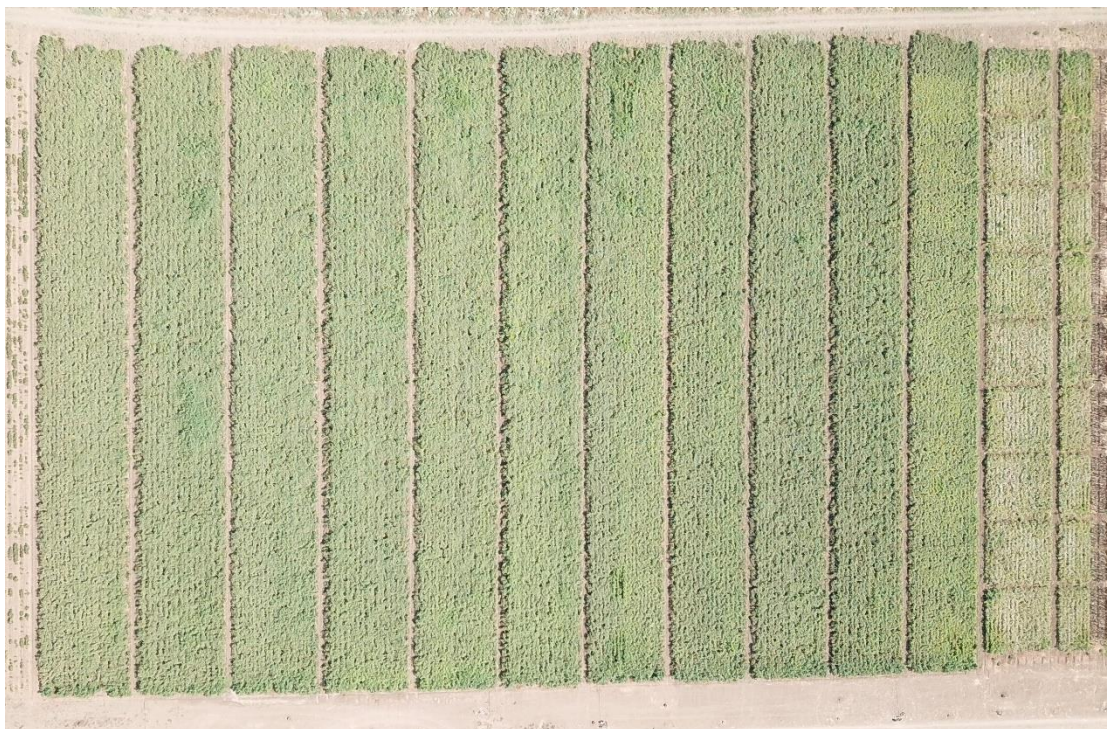
צילום מס. 3: תבנית השטח