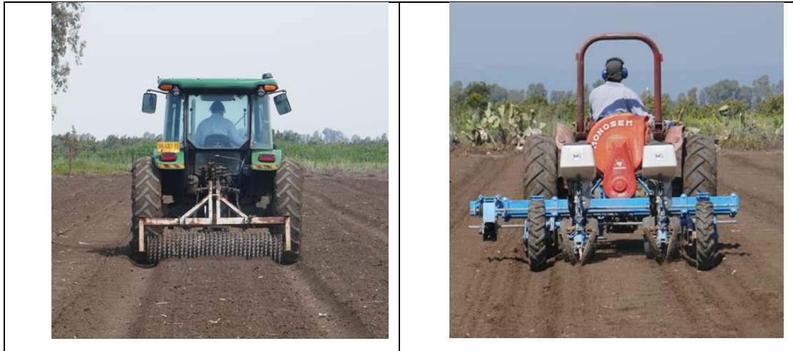
96 ס"מ (38")

בחלקה של כ- 20 דונם נזרעה כותנה מהזן V-70. לסרוגין: בקטעים של 16 שורות במרווח של 96 ס"מ (38", מקובל) ו- 20 שורות במרווח 76 ס"מ (30", צר). 1.9 ו- 1.92 דונם לקטע בהתאמה. סה"כ 6 קטעים לכל מרווח. בוצע באמצעות שני טרקטורים שונים אחד לכל מרווח. צילום מספר 1 ו-2: טרקטור לכל מרווח.